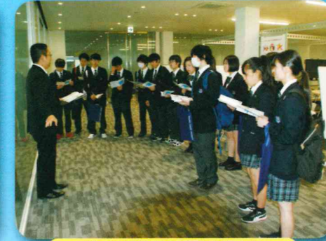
学校職場見学会 東北学院大学