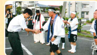
政宗公まつり・宇和島市牛鬼保存会会長と握手