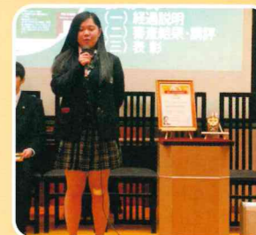
おおさき社会貢献大賞表彰式