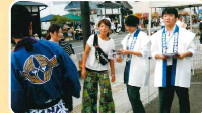
政宗公まつり・ボランティアガイド