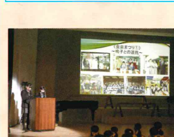
志教育実践発表会

私たち生徒会総務部は、岩高生の学校生活をより豊かにするために多くの学校行事の企画・運営に努めています。生徒大会や体育祭、文化祭などの学校行事の時期に合わせて、昼休みや放課後に集まって話し合いをしています。また、写真にあるように、岩高での取り組みを学校外の方々に説明することもあります。興味がある方は、ぜひ私たちと活動しましょう。