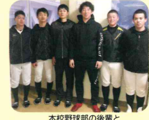
本校野球部の後輩と

昨年見事プロ初勝利を挙げ、今年からは「東京ヤクルトスワローズ」の選手として心機一転頑張っています。