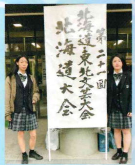
第二十一回全国高文連