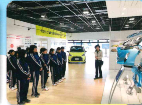
学校職場見学会 トヨタ自動車