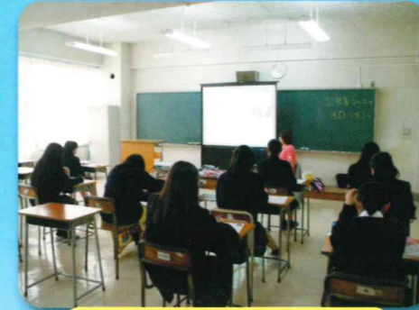
進路別ガイダンス

入学した当初から、将来を見据えた進路指導を行うことにより、希望する進路を実現するよう、3年間の見通しを持った指導を実施しています。