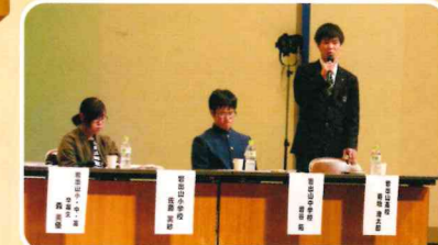
志教育実践発表会・パネルディスカッション