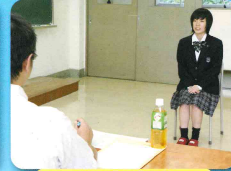
岩出山RC就職模擬面接