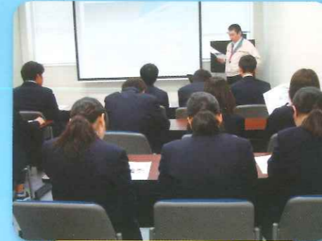
学校職場見学会 トヨタ紡織

入学した当初から、将来を見据えた進路指導を行うことにより、希望する進路を実現するよう、3年間の見通しを持った指導を実施しています。