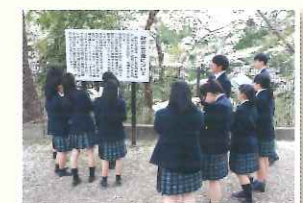
地域探訪（城山公園）