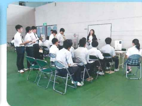
大崎市合同企業説明会