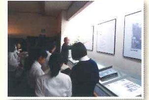
フィールドワーク（中鉢美術館）

班毎に調査活動を行い、その結果をまとめた発表会では、「悠備館市」職員としてよりよいまちづくりをプレゼンする。