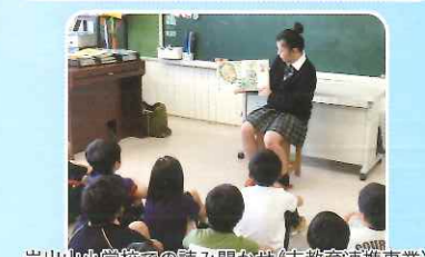
岩出山小学校での読み聞かせ(志教育連携事業)