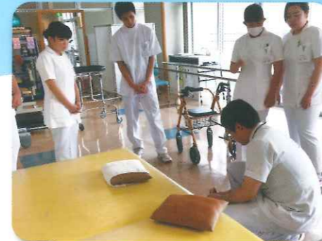
職場体験(星陵病院)