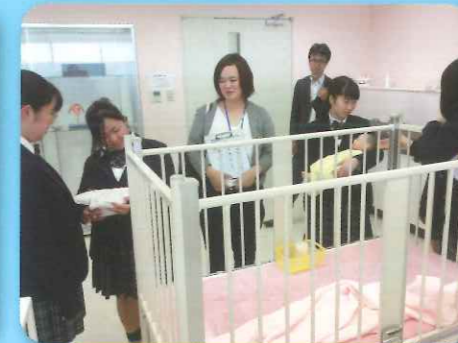
学校職場見学会 仙台青葉短期大学