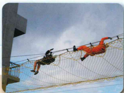
2年職場体験(大崎市消防署)