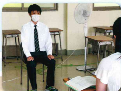
3年生集中模擬面接指導