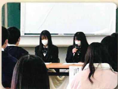
先輩に学ぶ会(進学コース)