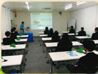
学校職場見学会(株式会社東北イノアック)