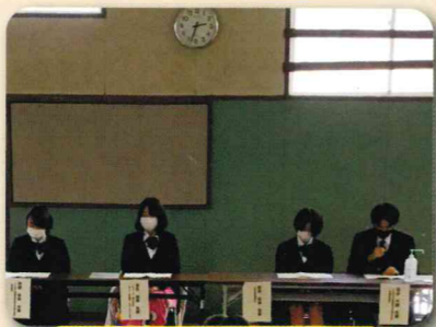
先輩に学ぶ会(就職コース)