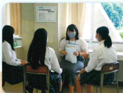
進路別ガイダンス

入学した当初から、将来を見据えた進路指導を行うことにより、希望する進路を実現するよう、3年間の見通しを持った指導を実施しています。