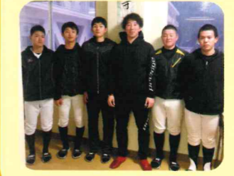
本校野球部の後輩と