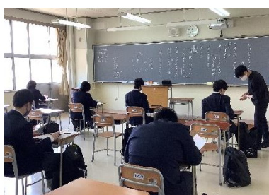
授業の様子（国語・英語）