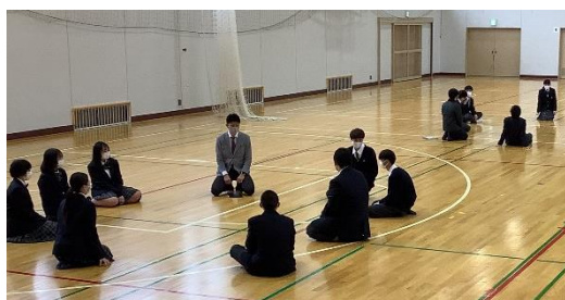
I.H.Rでのアクティビティの様子