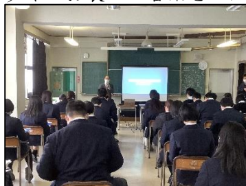
1.12 S P I 対策セミナー

それぞれの班が発表を無事に終わることが出来、審査をしてくれた皆さんからは「グループで丸となって発表していて良かった」、「課題設定から見学・体験を経て、提案されている内容がとてものを得ていて素晴らしかった」、「聞く側の生徒の態度も真剣に聞いていて立派だった」と多くのお褒めの言葉をいただき、大変有意義な発表会になりました。